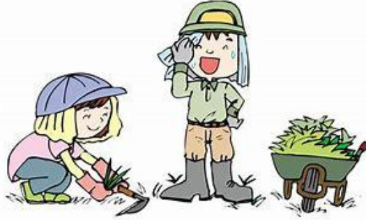
生活支援サービス・有償ボランティア