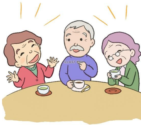
地域の茶の間・サロン