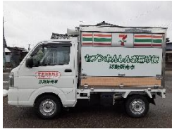
お買い物代行サービス 移動スーパーなど